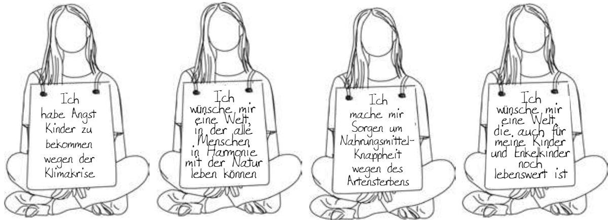
Beispiele für persönliche Botschaften

Die Verwendung eines Banners ist aus Sicherheitsgründen notwendig (sonst können Menschen leichter versucht sein, durch die Blockade durchzufahren), solange der Verkehr nicht von der Polizei umgeleitet wird. >> BANNER VORLAGEN